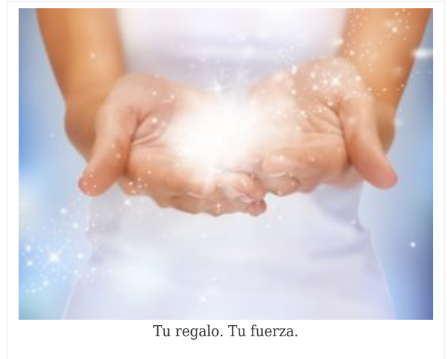
Tu regalo. Tu fuerza.