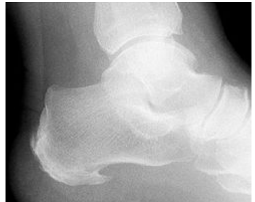
Espolón calcaneo. En relación a fascitis plantar.

Remarco los que se ha demostrado que obtiene mejores resultados de la fascitis plantar .