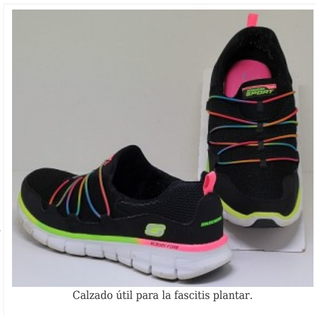
Calzado útil para la fascitis plantar.

Volvió en octubre más feliz que unas pascuas, como una runner, curada , encantada. Me