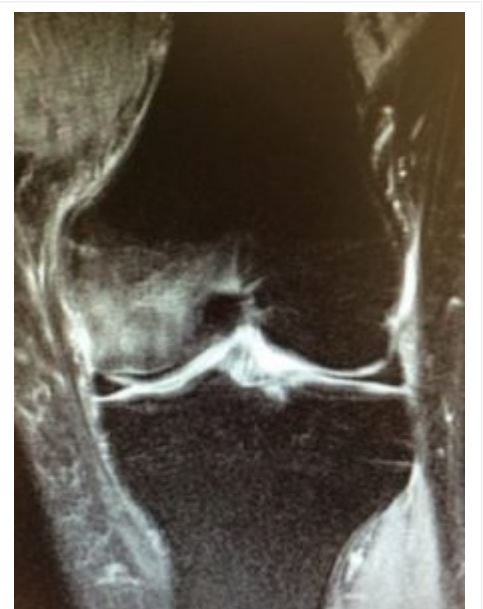
Resonancia de rodilla. Corte frontal o coronal. Fémur arriba. Meniscos en medio. Tibia abajo. Observa el edema óseo del fémur a tu izquierda.

Puede que no te sientas tan incómodo cuando veas a un doctor concentrado, callado, ensimismado, intentando descubrir el origen de tu enfermedad. Prométeme que no se lo tendrás en cuenta, puede que no hay podido explicarte nada porqué quizá tu has sido el reto más grande del día de furia que ha tenido.