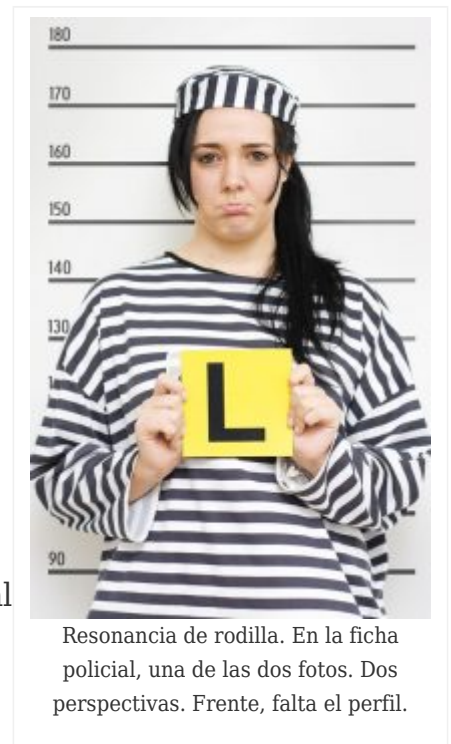
Resonancia de rodilla. En la ficha policial, una de las dos fotos. Dos perspectivas. Frente, falta el perfil.