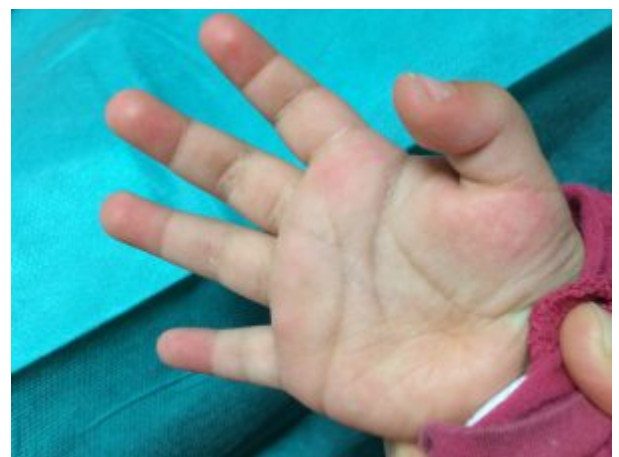
Dedo en resorte infantil. Observa la posición en flexión del dedo pulgar.

Pero la gracia está en diagnosticarlo tempranamente.