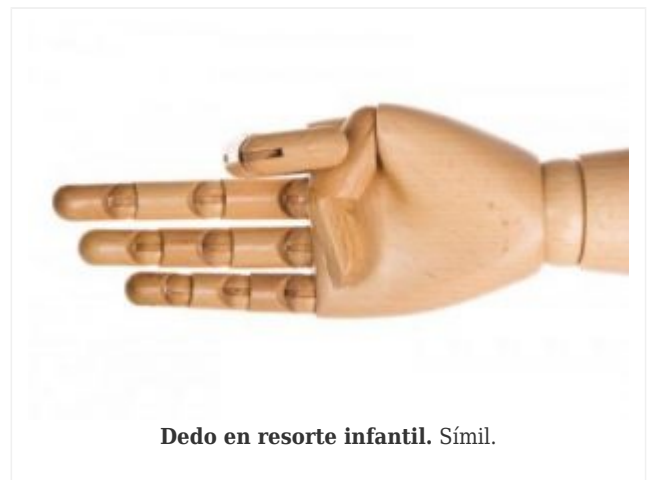
Dedo en resorte infantil. Símil.

Lo mejor: jugar con el pulgar que ya no se engancha.