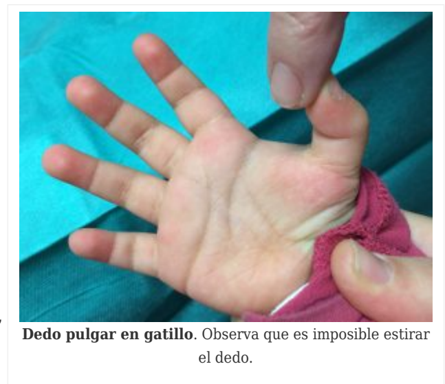
Dedo pulgar en gatillo. Observa que es imposible estirar el dedo.

Te explico. Cuando nace un bebé su sistema musculoesquelético es inmaduro. Nace rígido - para que me entiendas-. Y poco a poco se relajan primero extremidades superiores y luego