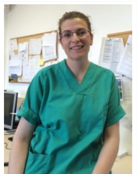
Miranda Trauma, vestida de quirófano, vestida de verde.

Espero y deseo que este artículo haya ayudado a disipar parte de tus miedos por tu próxima entrada en quirófano . Seguro.