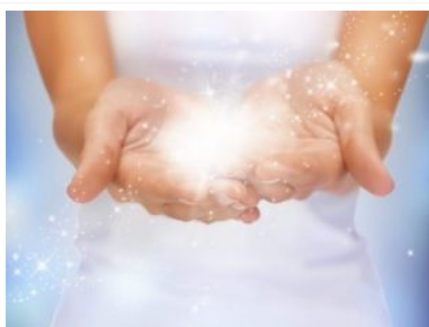
Quirófano: las manos de las enfermeras tienen poder. Te lo aseguro.