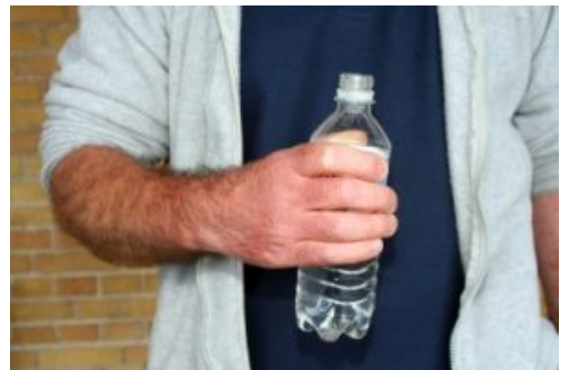
Quirófano: En ayunas es en ayunas. Ni agua!

Otras veces el motivo era la llegada de un nieto. O la celebración de 50 años de casados (que no es poco).