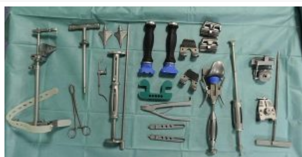
En quirófano. Foto de El Correo (ver artículo mencionado).

Tan importante en el correcto funcionamiento de un quirófano es la enfermera instrumentista como la empleada de la limpieza. Si la empleada no es diligente o está ocupada en otro quirófano. El ritmo entre cirugía y cirugía puede ser un horror. Y los